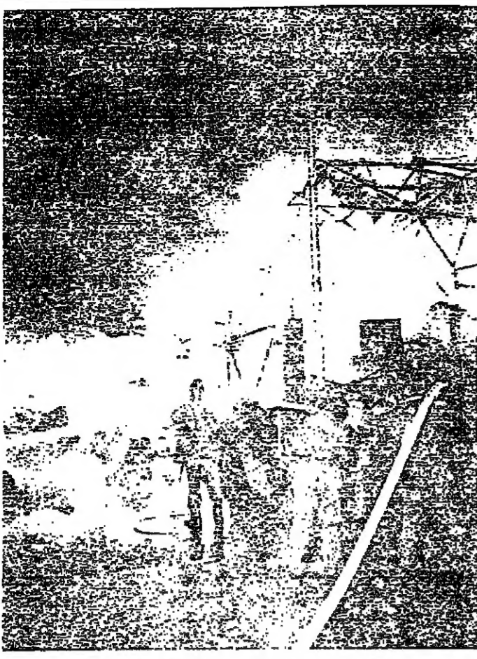
رجال الاطفاء اثناء عملية اخفاء الحريق